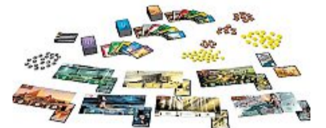
SCHÖNES SPIEL: „7 Wonders“ ist ganz ausgezeichnet.

Das anspruchsvolle Kartenspiel „7 Wonders“ (Repos Production/Asmodee) bekommt nach der Auszeichnung „Kennerspiel des Jahres“ nun auch den Deutschen Spielepreis 2011. Den Deutschen Kinderspielpreis erhält „Monsterfalle“ (Kosmos). Beide Auszeichnungen werden heute in Essen verliehen, am Vorabend der weltgrößten Fachmesse Spiel, die morgen beginnt.